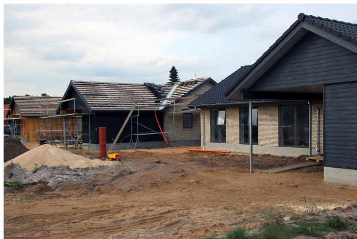
Nye huse på Sognegårdsvej, 2018