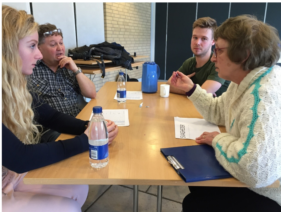
Den yngre og ældre generation mødes til mødet i marts 2018

Der blev også peget på udefra kommende trusler mod Filskovs evne til fortsat at være en velfungerende landsby, der dækker mange af indbyggernes behov i hverdagslivet. Trusler er forhold, som Filskov ikke selv kan ændre, men i visse tilfælde har vi mulighed for at påvirke dem. Under alle omstændigheder er trusler et vilkår, som vi skal forholde os konstruktivt til, når vi arbejder med udvikling af Filskov.