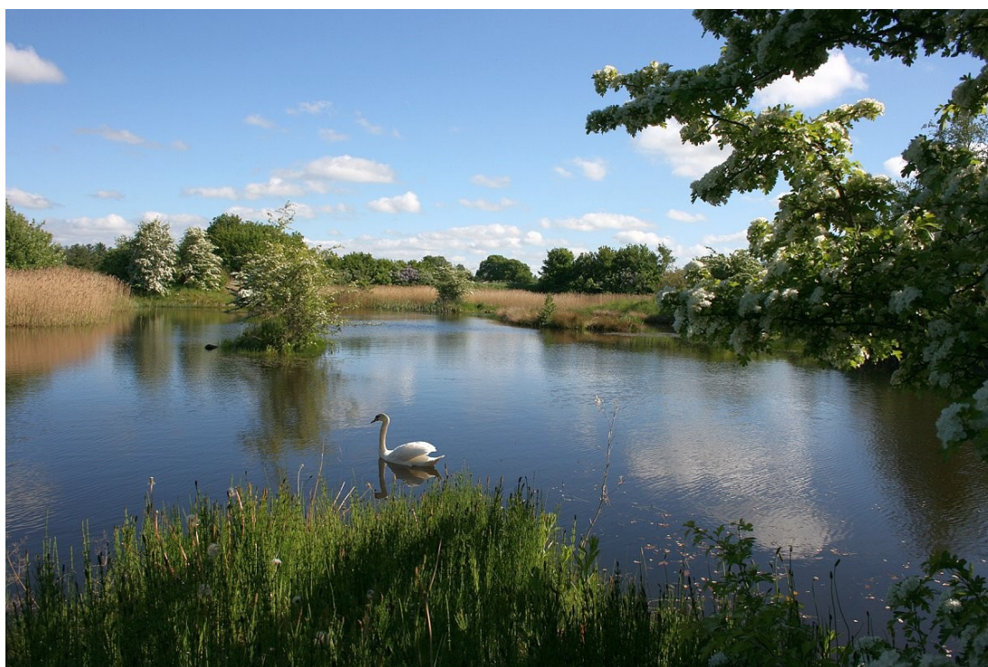
Mergelgrav med svaner

Sammenholdet er vigtigt i en lille landsby, som tager ansvar for vedligehold og udvikling. Gensidig tillid mellem borgerne er det nødvendige grundlag for at gøre Filskov til et godt sted at være.